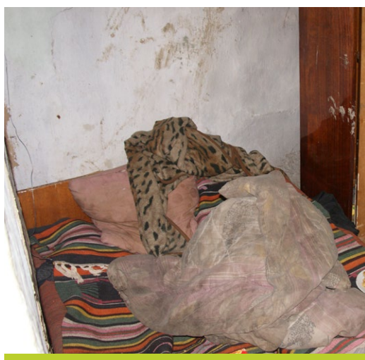
Les enfants dorment ici.

Alexander, 13 ans, a quitté l'école, il passe son temps avec des camarades dans la rue. Ses frères vont certes encore à l'école, mais sans grand intérêt. Il est prévisible qu'ils abandonneront également.