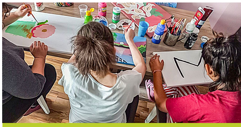
Kreativzeit im Schutzhaus

Doch ich spüre, dass ich langsam Fortschritte mache. Ich fühle mich nicht mehr so ohnmächtig und hoffnungslos wie zu Beginn und lerne wieder, mir selbst und anderen zu vertrauen. Ich bin sehr dankbar für die Hilfe, die ich hier bekomme. Heute kann ich wieder glauben, dass es für mich eine Zukunft gibt und ein Leben, das sich lohnt.»