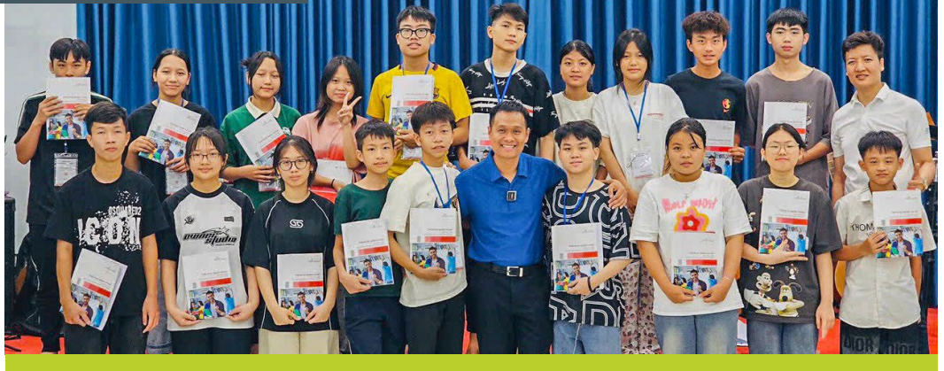
Cong avec les participants d'un cours « Me and My Future ».