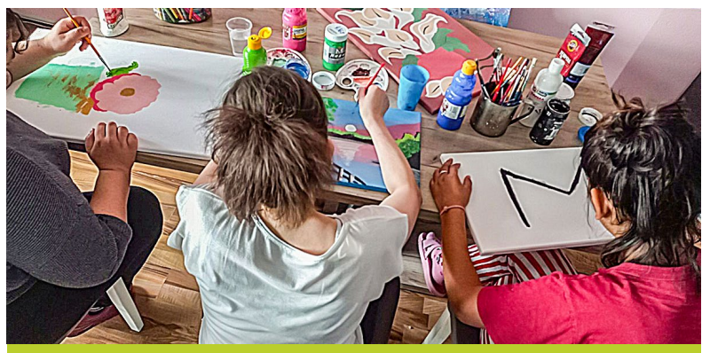
Moments de créativité à la maison d'accueil sécurisée.

Mais je sens que je progresse lentement. Je ne me sens plus aussi impuissante et désespérée qu'au début et j'apprends à faire à nouveau confiance, à moi-même et aux autres. Je suis très reconnaissante de l'aide que je reçois ici. Aujourd'hui, je peux à nouveau croire que j'ai un avenir et qu'une vie qui vaut la peine d'être vécue m'attend. »